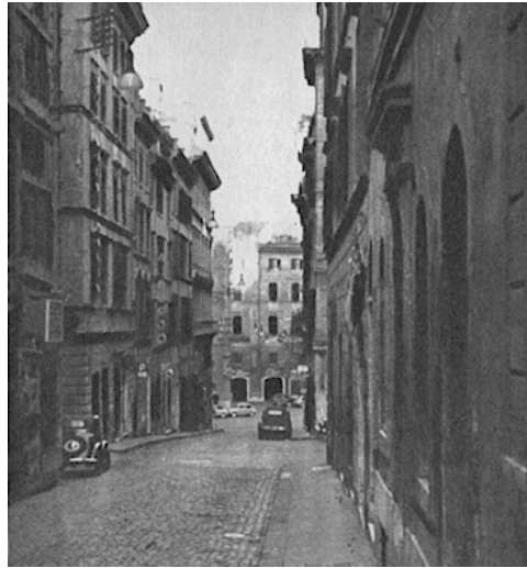
Via Rasella, luogo dell'attentato (foto dell'epoca)